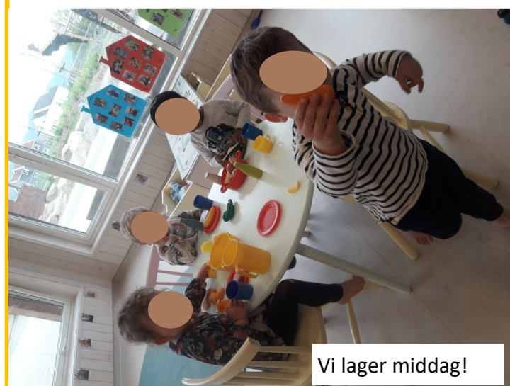
Vi lager middag!