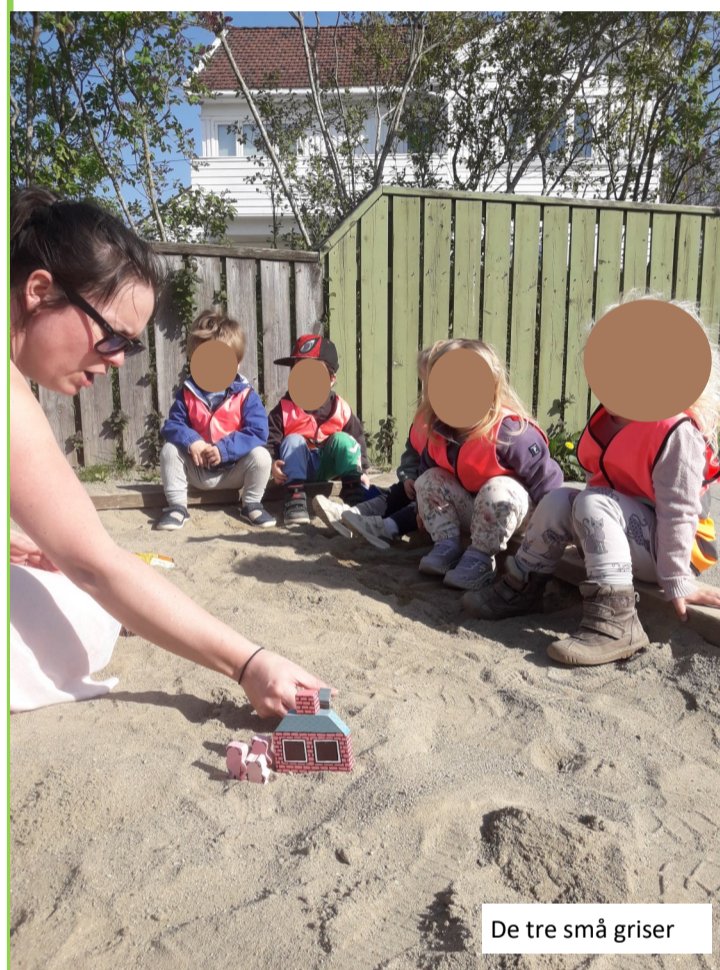
De tre små griser